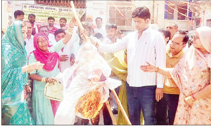
महिलाओं को शक्ति मानकर उनके सशक्तिकरण का सपना देख रहे हैं, वहीं