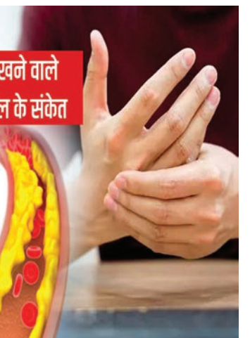
हाथों पर दिखने वाले हाई कोलेस्ट्रॉल के संकेत

करना पड़ता है। अगर आपको लगातार उंगलियों में दर्द की समस्या है, तो यह हाई कोलेस्ट्रॉल के कारण हो सकती है। उंगलियों में दबाव पड़ने पर दर्द: काम करते समय या उंगलियों पर किसी तरह का दबाव पड़ने पर दर्द होना भी हाई कोलेस्ट्रॉल का लक्षण हो सकता है। इस स्थिति को नजरअंदाज करने से बचना चाहिए। उंगलियों में पीलापन: हाथ की उंगलियों में पीलापन भी हाई कोलेस्ट्रॉल का संकेत माना जाता है। कोलेस्ट्रॉल बढ़ने के कारण आपको Xanthelasma हो सकता है और इसकी वजह से आपकी स्किन का रंग पीला होने लगता है।