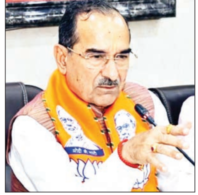
उजागर कर रही है। राठौड़ ने अशोक गहलोट के उस बयान पर भी सवाल उठाया, जिसमें

जयपुर (नवयत्न)। राजस्थान की राजनीति में आरोप-प्रत्यारोप का दौर तेज हो गया है। प्रदेश भाजपा के वरिष्ठ नेता और प्रदेश अध्यक्ष मदन राठौड़ ने पूर्व मुख्यमंत्री अशोक गहलोट और सचिन पायलट की हालिया तस्वीरों को लेकर तीखा हमला बोला है। राठौड़ ने कहा कि सार्वजनिक रूप से साथ आकर तस्वीरें खिंचवाना कांग्रेस नेताओं की वास्तविक एकजुटता नहीं, बल्कि उनके अंदरूनी मतभेदों को छिपाने की कोशिश है। उन्होंने तंज करते हुए कहा कि श्वार-बार फोटो के जरिए एकता दिखाने की कोशिश यह बताती है कि हकीकत में सब कुछ ठीक नहीं है। दिखावे की यह एकजुटता उनके आपसी मतभेदों को और