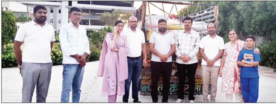
समाज में मानवता, करुणा और सहयोग की भावना को भी यशस्क करने का कार्य करेगा। इस प्रकार