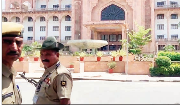
वापे-वापे की ली तलाशी, नहीं मिला कुछ संदिग्ध