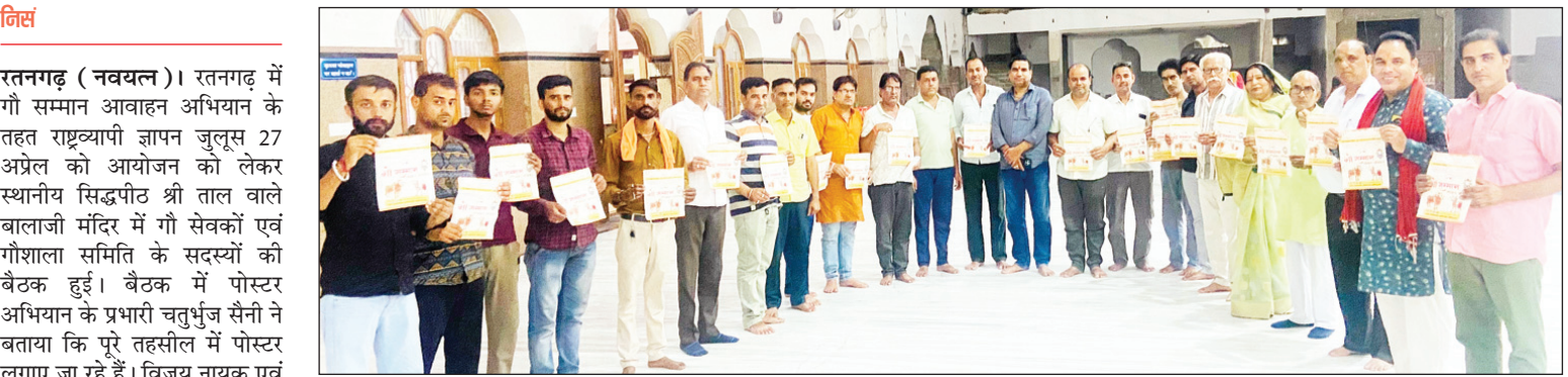
लक्ष्य पूरा करने का आश्वासन देने वाला आगामी 27 अप्रैल को सुबह 10 बजे सिद्धपीठ श्री ताल वाले बालाजी मंदिर से रवाना होकर जुलूस उपखंड कार्यालय पहुंच कर ज्ञापन सौंपा जाएगा। इस पर विस्तार से चर्चा हुई एवं बैठक