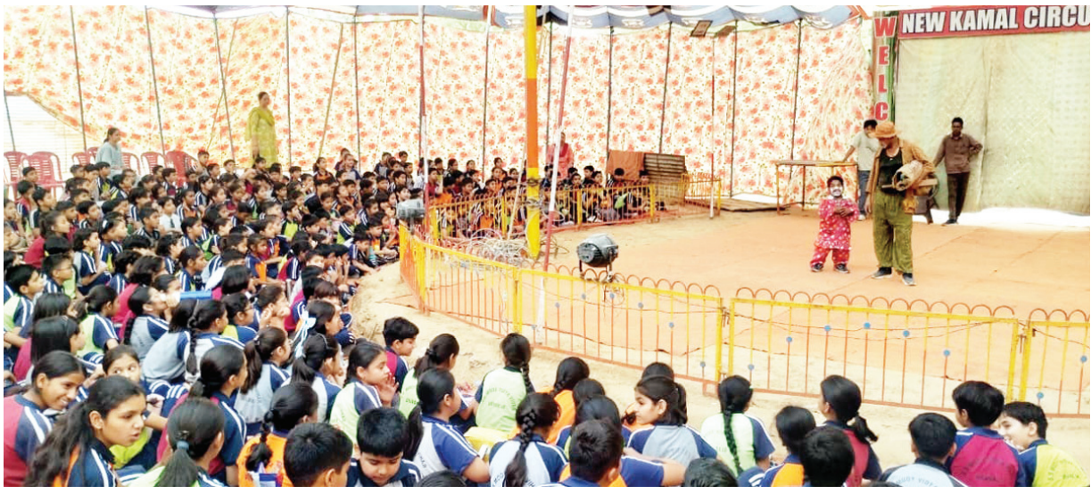
गया था ताकि आज की पीढ़ी इस कला से अनजान ना रहे।