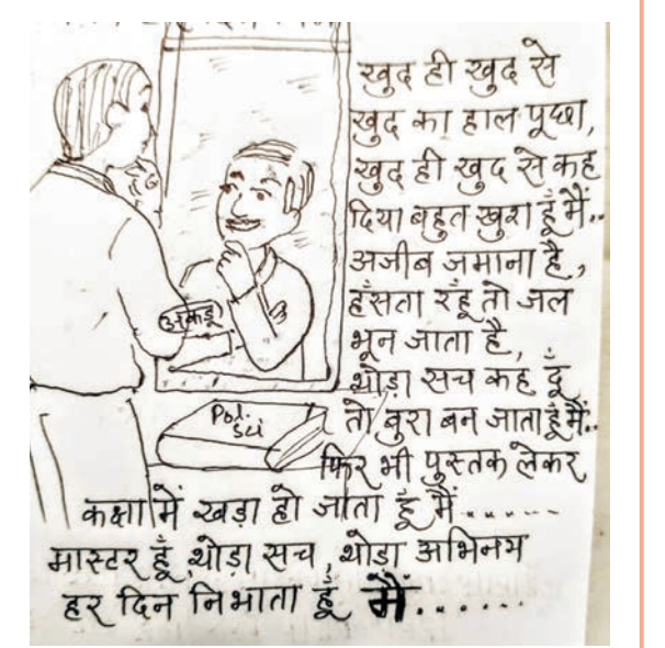
मास्टर हूँ, थोड़ा सच, थोड़ा अभिन्न हर दिन निभाता हूँ मैं.....