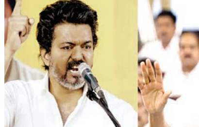
एग्जिट पोल के अनुसार, द्रविड़ मुन्नेत्र कजगम (डीएमके) तमिलनाडु में आराम से सत्ता बरकरार रखने के लिए तैयार है। उसने एआईडीएमके के नेतृत्व वाले गठबंधन और अभिनेता से राजनेता बने विजय की तमिलनाडु वेत्री कजगम (टीवीके) की चुनावी चुनौती को आसानी से खारिज कर दिया है। पी-मार्क और मैट्रिक्स के अनुमानों के अनुसार, गठबंधन को 122-132 सीटें मिल सकती हैं, जबकि पीपुल्स पल्स के अनुमानों के अनुसार उसे 125-145 सीटों का बड़ा अंतर मिलेगा। कम से कम अनुमान भी डीएमके के लिए लगातार दूसरी बार सत्ता में आने के लिए पर्याप्त है। वहीं, सर्वेक्षण के आधार पर एआईडीएमके के नेतृत्व वाले गठबंधन को 65 से 100 सीटें मिलने का अनुमान है।