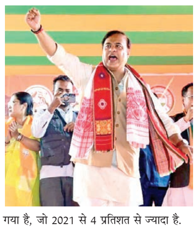
गया है, जो 2021 से 4 प्रतिशत से ज्यादा है।

भाजपा का वोट शेयर 36.47 प्रतिशत के आसपास बताया गया है, जो उसकी चुनावी रणनीति की सफलता को दर्शाता है। भाजपा के सहयोगियों का रिजल्ट कैसा? एनडीए के अन्य सहयोगियों में बोडोलैंड पीपुल्स फ्रंट (बीपीएफ) और असम गण परिषद (एजीपी) शामिल हैं। बीपीएफ ने 11 सीटों पर चुनाव लड़ा और उसे 5 से 7 सीटें मिलने का अनुमान है, जबकि उसका वोट शेयर 3.89 प्रतिशत बताया गया है। वहीं, एजीपी ने 24 सीटों पर उम्मीदवार उतारे और उसे 6 से 8 सीटें मिल सकती हैं, उसका वोट शेयर 6.74 प्रतिशत के आसपास रहने का अनुमान है। कुल मिलाकर एनडीए का वोट शेयर 47.10 प्रतिशत बताया