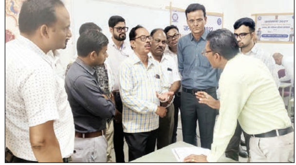
जिसके कारण ऐसे शिक्षक जिनके पास पुराने मोबाइल उनको नया