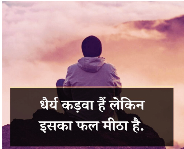
धैर्य कड़ा है लेकिन इसका फल मीठा है।

ये प्रश्न इसलिए महत्वपूर्ण हो जाते हैं, क्योंकि इस तरह के ज्यादातर मामलों में पुलिस या अन्य जांच एजेंसियां अपराधियों तक पहुंच ही नहीं पाती हैं। गौरतलब है कि हाल के वर्षों में बम की झूठी धमकियां देने की घटनाएं तेजी से बढ़ी हैं। मई, 2024 में दिल्ली-एनसीआर में एक ही दिन में करीब ढाई सौ स्कूलों को बम से उड़ाने की धमकी से पुलिस के हाथ-पांव फूल गए थे। हालांकि, इस तरह की तमाम धमकियां झूठी साबित हुईं, लेकिन इससे जहां दहशत का माहौल पैदा हो जाता है, वहीं जांच एजेंसियों के सामने कई चुनौतियां पैदा हो जाती हैं। ऐसे मामलों में अब तक की जांच में सामने आया है कि धमकी भरे ज्यादातर ई-मेल वीडियो यानी वॉट्सअप प्रॉवैडर नेटवर्क के जरिए विदेशी आईपी पते से भेजे जाते हैं। मगर आज डिजिटल तकनीक इतनी विकसित हो चुकी है कि इसके जरिए दुनिया के किसी भी कोने में छिपे अपराधी को खोजा जा सकता है। मगर पुलिस और अन्य जांच एजेंसियों में अलग से बनाई गई साइबर शाखाओं के विशेषज्ञ क्या डिजिटल तकनीक में इतने पारंगत नहीं हैं कि वे ऐसे अपराधियों का पता ला सकें? सरकार और प्रशासन को इस पर गंभीरता से विचार करना होगा, क्योंकि यह केवल दहशत फैलाने का मामला नहीं है, बल्कि देश की सुरक्षा और तकनीकी क्षमता का भी सवाल है।