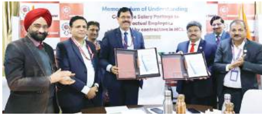
लाभ दिया गया है। उन्होंने बताया कि इस प्रकार की योजना पहले किसी भी सेक्टर में जारी नहीं की गई। उन्होंने बताया कि इस योजना में दस हजार रूपए मासिक वेतन पाने

निस खेतड़ी नगर (नवयत्न)। हिंदुस्तान कॉर्पोरेट लिमिटेड एचसीएल ने ठेका कर्मियों के कल्याण और वित्तीय समावेशन की दिशा में एक ऐतिहासिक कदम उठाते हुए भारतीय स्टेट बैंक एसबीआई के साथ समझौता ज्ञापन एमओयू पर हस्ताक्षर किए। यह समझौता वैध अनुबंधों के तहत कार्यरत ठेका कर्मचारियों के लिए कॉर्पोरेट वेतन पैकेज समाधान के विस्तार से जुड़ा है, जो न केवल उनकी आय सुरक्षा को मजबूत करेगा, बल्कि