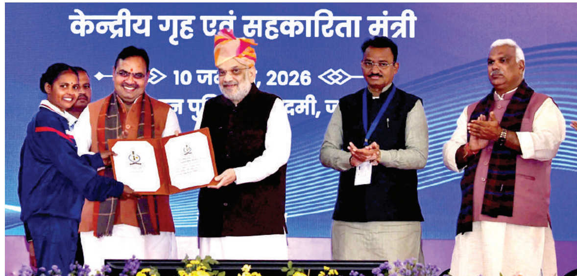
राजस्थान पुलिस देश का अग्रणी पुलिस बल-

केन्द्रीय गृह मंत्री ने नक्सलवाद का सफाया कर मजबूत की आंतरिक सुरक्षा-श्री शर्मा ने कहा कि केन्द्रीय गृह मंत्री ने नक्सलवाद का सफाया करते हुए देश की आंतरिक सुरक्षा को सुदृढ़ करने का काम किया। देश में औपनिवेशिक मानसिकता वाले कानूनों को समाप्त कर लाए गए तीन नए कानूनों से देश की न्याय प्रणाली को अधिक लोकतांत्रिक बनाया गया है। सीएए कानून के माध्यम से पाकिस्तान, बांग्लादेश और अफगानिस्तान में धार्मिक उत्पीड़न झेलने वाले अल्पसंख्यकों को भारतीय नागरिकता देने की राह खोली है। साथ ही, पूर्वोत्तर में महत्वपूर्ण शांति समझौतों से बड़ी संख्या में युवा हथियार छोड़कर मुख्यधारा में लौटे हैं जिससे देश का पूर्वोत्तर भाग शांति और विकास के मार्ग पर तेजी से आगे बढ़ रहा है।