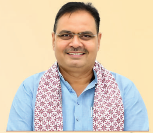
श्री भजनलाल शर्मा माननीय मुख्यमंत्री

2 साल नव उत्थान - नई पहचान बढ़ता राजस्थान - हमारा राजस्थान