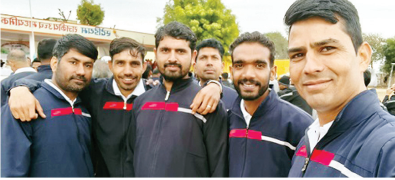
700 खिलाड़ी ले रहे हैं भाग