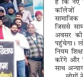
UGC के कारते कल्ल के खिलफ विरोध प्रदर्शन एवं ज्ञापन (सीकर)

खण्डेला (नवयत्न)। यूजीसी द्वारा जारी नए नियमों के विरोध में खण्डेला में सर्व समाज के लोगों ने आक्रोश जताया। इस दौरान बिहारीजी मंदिर से एसडीएम कार्यालय तक रैली निकालकर उपखण्ड अधिकारी को राष्ट्रपति के नाम ज्ञापन सौंपा गया। विरोध करने वालों ने यूजीसी के नए नियमों को भेदभावपूर्ण बताते हुए इन्हें तत्काल प्रभाव से निरस्त करने को