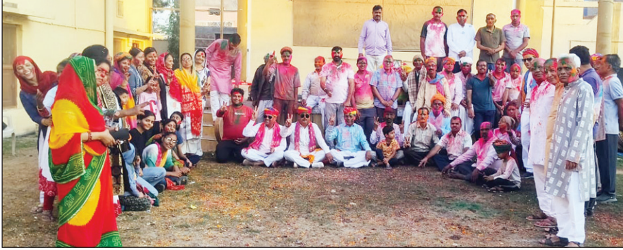
के पदाधिकारियों एवं सदस्यों का विशेष योगदान रहा। सभी समितियों ने तन, मन और धन से

सरदारशहर (नवयत्न) । लोकरंजन परिषद में आयोजित फागोत्सव 2026 का कार्यक्रम अत्यंत हर्षोल्लास, उत्साह एवं गरिमामय वातावरण में सफलतापूर्वक संपन्न हुआ। रंग, उमंग और लोक परंपराओं से सजे इस भव्य आयोजन ने उपस्थित जनसमूह को आनंदित कर दिया। कार्यक्रम की सफलता में नामदेव निःशुल्क योग समिति, राममंच समिति तथा शिवबाड़ी योग समिति