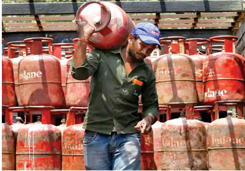
डिलीवरी की बुकिंग 25 दिन के अंतराल में

इजरायल-अमेरिका और ईरान के बीच चल रहे युद्ध का असर अब राजस्थान में दिखने लगा है। तेल कंपनियों ने रसोई गैस के घटते स्टॉक को देखते हुए कॉमर्शियल गैस सिलेंडर की डिलीवरी पर अघोषित रोक लगा दी है। एजेंसियों को मैसेज करके कॉमर्शियल सिलेंडर के ऑर्डर नहीं लगाने के आदेश दिए हैं। केवल घरेलू उपयोग के सिलेंडर की डिलीवरी पर ही फोकस करने के लिए कहा गया है। कंपनियों ने देर रात ये निर्देश जारी किए हैं। कंपनियों के इस निर्णय का असर अब औद्योगिक इकाइयों, रेस्टोरेंट्स और होटलों पर पड़ेगा। वहीं सावे शुरू होने के कारण शादी-समारोह में भी गैस सप्लाई की किल्लत देखने को मिल सकती है। तेल कंपनियों के सब कुछ सामान्य के दावों के बीच अब आगामी निर्देशों तक कॉमर्शियल गैस सिलेंडरों की सप्लाई रोकने के लिए कहा है।