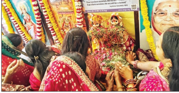
मैं विशेष आकर्षण के रूप में श्री गणगौर-ईसर स्वरूप का विशेष पूजन किया जाएगा। पारंपरिक

जयपुर (नवयत्न)। चैत्र मास के सुहाग पर्व गणगौर के उपलक्ष्य में मुरलीपुरा के विकासनगर में गौरव बाल निकेतन स्कूल के पास होली चौराहे पर रविवार, 15 मार्च को सुबह 10 से 11 बजे तक सामूहिक गणगौर-ईसर पूजन समारोह आयोजित किया जाएगा। कार्यक्रम में शामिल होने वाली महिलाओं को पूजन सामग्री निःशुल्क उपलब्ध कराई जाएगी। आयोजन