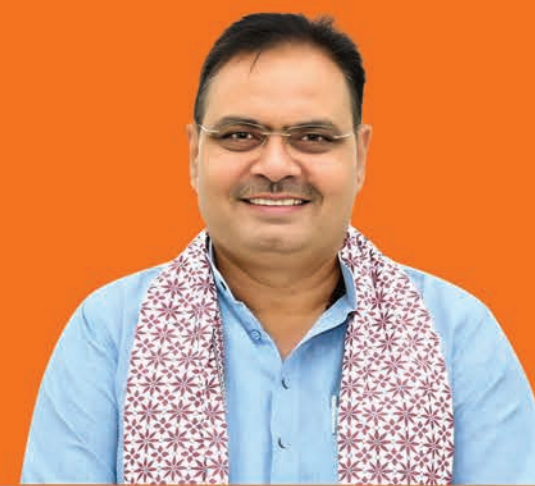
श्री भजनलाल शर्मा माननीय मुख्यमंत्री