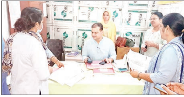
केयर यूनिट, शिशु गहन चिकित्सा इकाई, कंगा : मदन केयर यूनिट,