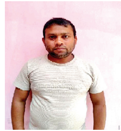
गोपनीय सूचनाएं एकत्रित करता और सोशल मीडिया के जरिए पाक हैंडलर्स तक पहुंचाता था। राजस्थान इंटेलिजेंस की टीम ने एयरफोर्स इंटेलिजेंस, नई दिल्ली के साथ मिलकर संयुक्त कार्रवाई करते हुए आरोपी को छबुआ से डिटेन किया और जयपुर स्थित केंद्रीय पूछताछ केंद्र लाया गया। यहां विभिन्न खुफिया एजेंसियों द्वारा