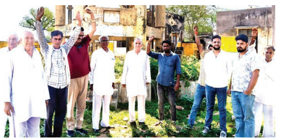
समय हादसे की आशंका बनी रहती है। ग्रामीणों ने बताया कि जब तक नई टंकी से सप्लाई शुरू नहीं होती है तब तक इसकी सफाई करवाकर साफ पानी की सप्लाई जारी रखें।

इस टंकी का निर्माण सन 1995 में हुआ था। फिलहाल यह काफी जर्जर हालत में है। साथ ही ग्रामीणों का कहना है कि यह टंकी कई जगहों से लकीज है जिससे पानी रिसाव हो रहा है। इससे हर