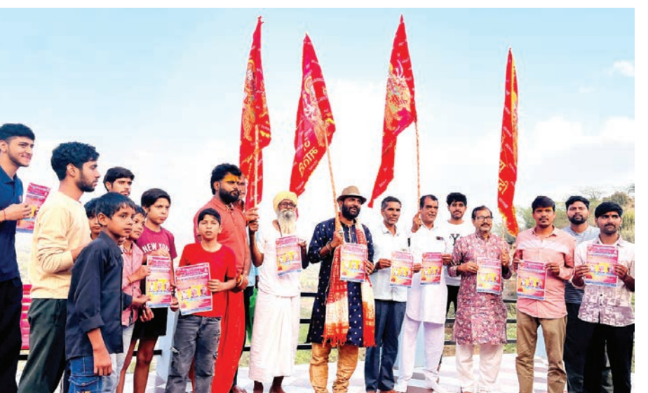
बजे गांव के श्री रामसागर बालाजी से गांव की परिक्रमा के साथ चामुंडा माता शक्ति पीठ तक कलश यात्रा निकाली जाएगी। दोपहर में हवन की पूर्णाहृति के बाद भंडारे का आयोजन चलेगा। संत महात्माओं की विदाई कार्यक्रम होगा। सायं सवा 4 बजे कुश्ती प्रतियोगिता होगी। मेले में नामचीन पोड़ी और उंटों का नृत्य कार्यक्रम भी रखा गया है। दो दिवसीय मेले में मंदिर पर अब तक सहयोग करने वाले भामाशाहों एवं वालीयटों के साथ ही गांव के सरकारी नौकरियों में चयनित होने वाले एवं उल्लेखनीय सेवा देने वाली प्रतिभाओं का सम्मान भी किया जाएगा। मेले को सफल बनाने के लिए मेला कमेटी ने सेवा भावी लोगों को अलग-अलग जिम्मेदारियां सौंपी है। पोस्टर विमोचन कार्यक्रम में गांव के कई प्रतिष्ठित लोग शामिल हुए हैं।