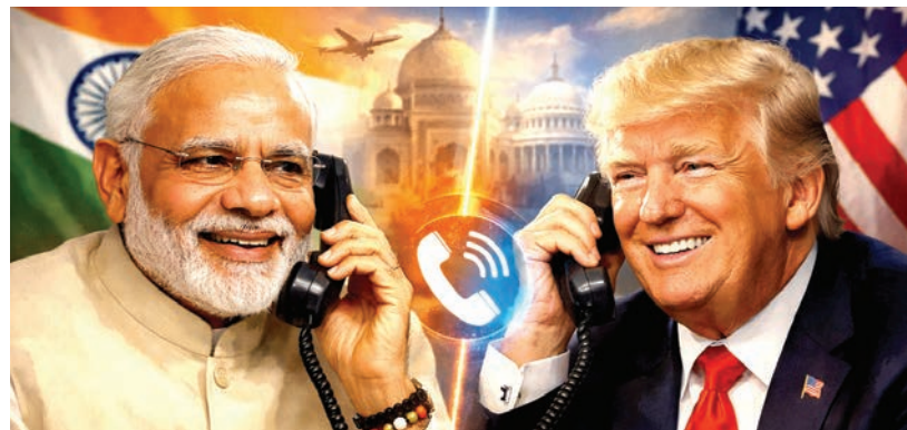
ट्रम्प ने ईरान पर हमला 5 दिन के लिए टाला

ईरान जंग के बीच अमेरिकी राष्ट्रपति डोनाल्ड ट्रम्प ने प्रधानमंत्री नरेंद्र मोदी से फोन कर बातचीत की है। भारत में अमेरिकी राजदूत सर्जियो गोर ने एक्स पर पोस्ट कर इसकी जानकारी दी है। उनके मुताबिक, दोनों नेताओं ने मिडिल ईस्ट के मौजूदा हालात पर चर्चा की। खास तौर पर होर्मुज स्ट्रेट को खुला रखने की अहमियत पर जोर दिया गया। पीएम मोदी ने ट्रंप पर पोस्ट कर कहा कि भारत तनाव कम करने और जल्द से जल्द शांति बहाल करने का समर्थन करता है। दूसरी तरफ खबर है कि ईरानी सुप्रीम लीडर मुजतबा खामेनेई अमेरिका के साथ बातचीत के लिए तैयार हैं। खामेनेई ने युद्ध को ईरान की शर्तों के अनुसार जल्द खत्म करने पर सहमति जताई है। अल अरबिया की रिपोर्ट के मुताबिक, ईरान के विदेश मंत्री अब्बास अरघचो ने अमेरिकी दूत स्टीव वित्कोफ को गुप्त रूप से बताया कि सुप्रीम लीडर मुजतबा खामेनेई ने वार्ता के लिए अनुमति दी है।