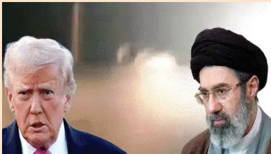
तेल अरब/तेहरान/वॉशिंगटन डीसी

ईरान ने अमेरिका के सीजफायर प्रस्ताव को खारिज कर दिया है। उसने कहा है कि वह राष्ट्रपति डोनाल्ड ट्रम्प की शर्तों पर जंग खत्म नहीं करेगा। ईरानी अधिकारियों के मुताबिक, अमेरिका ने मध्यस्थ देशों के जरिए जो प्रस्ताव भेजा, वह धोखा है और जमीनी हकीकत से कटा हुआ है और इसका मकसद सिर्फ दबाव बनाना है। ईरान ने कहा है कि युद्ध का अंत तभी होगा जब उसकी शर्तें पूरी होंगी। इसके लिए उसने 5 प्रमुख शर्तें रखी हैं-