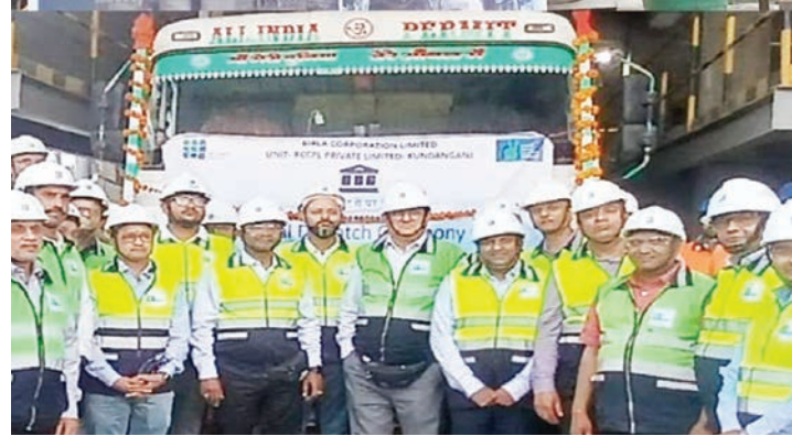
प्रदेश के मध्य और पूर्वी क्षेत्रों में कंपनी की मुख्य बाजारों में प्रतिस्पर्धात्मकता मजबूत होगी। अतिरिक्त क्लिकर कंपनी के सतना, चंदेरिया और मुकुटबन स्थित एकीकृत इकाइयों से प्राप्त किया जाएगा।

कोलकाता (नवयत्न)। बिरला कॉर्पोरेशन लिमिटेड की पूर्ण रूप से स्वामित्व वाली सहायक कंपनी आरसीसीपीएल प्राइवेट लिमिटेड ने सोमवार को अपनी कुन्दनगंज इकाई में उत्पादन की तीसरी लाइन शुरू की। जिससे उत्पादन क्षमता 1.4 मिलियन टन एमटी बढ़ गई। इस विस्तार के बाद बिरला कॉर्पोरेशन लिमिटेड की समेकित उत्पादन क्षमता 21.4 एमटी हो गई है और कंपनी द्वारा पहले घोषित अनुसार इसे 2028-29 तक 27.6 एमटी तक बढ़ाया जाएगा। कुन्दनगंज विस्तार की अनुमानित लागत लगभग 300 करोड़ रुपये है। प्राइइंडिया क्षमता में 1.4 एमटी की वृद्धि से लगभग 1,00,000 प्रत्यक्ष और अप्रत्यक्ष नौकरियां पैदा होने की उम्मीद है। साथ ही उत्तर