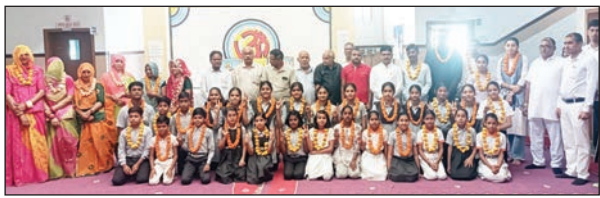
भैया बहिनों को बधाई एवं शुभकामनाएं दीं। वर्ष भर भैया बहिनों के कठिन परिश्रम, लगन के साथ समस्त स्टाफ एवं अभिभावकों के सहयोग के द्वारा विद्यार्थियों ने उत्कृष्ट परिणाम दिया इन्होंने केवल विद्यालय का गौरव ही नहीं बढ़ाया बल्कि संपूर्ण राजलदेसर का भी नाम रोशन किया है। इसके लिए कक्षा पंचमी में सभी ए ग्रेड वाले