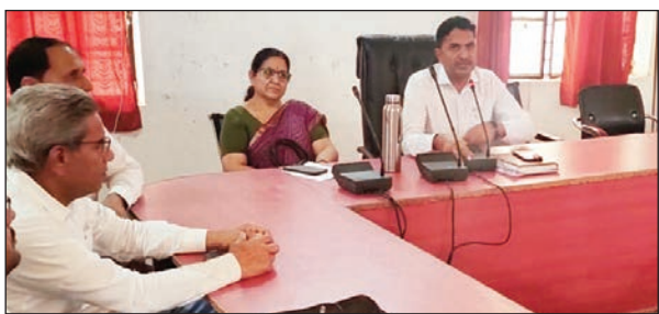
अभियान का शुभारंभ किया गया है। इस अभियान के तहत 14 से 15 वर्ष की बालिकाओं को सर्वाइल कैंसर की वैक्सिनेशन कराई जाएगी। उन्होंने बताया कि देश में महिलाओं को होने वाली कैंसर की बिमारी से बचाने के लिए इस अभियान का संचालन किया गया है, किसी प्रकार के रोग