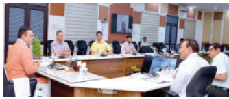
किसानों को फलदार पौधे उपलब्ध करवाएगी राज्य सरकार

नई दिल्ली। राज्य सरकार द्वारा वांसवाड़ा के झालरिया, उदयपुर के बांकी एवं गिरौरी के जयपुर में चंदन वन विकसित किए जाएंगे। इन प्रत्येक चंदन वन में 10 हजार से अधिक चंदन के पौधे रोपित किए जाएंगे। मुख्यमंत्री भजनलाल शर्मा ने रिविवा को मुख्यमंत्री मिशन पर आयोजित बैठक में इन चंदन वनों के लिए गुणवत्तापूर्ण पौधों का चयन करने तथा इनकी सुरक्षा के लिए चर्चित स्थानों पर फेंसिंग के कार्य एवं सिंचाई के लिए समुचित व्यवस्था