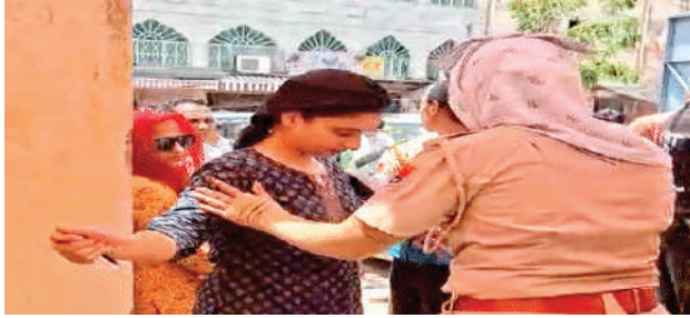
के हाथ में बंधे कलवा को सुरक्षाकर्मियों ने काटा। इसके बाद ही उन्हें प्रवेश दिया गया।

जयपुर। मेडिकल एंट्रेंस एग्जाम नीट यूजी 2026 को लेकर सुरक्षा के कड़े इंतजाम किए गए हैं। दुपट्टा ओढ़कर आने वाले महिला अभ्यर्थियों को एंट्री नहीं दी गई। स्टूडेंट्स के हाथों में बंधे कलवा तक कटवा दिए गए। जूते भी सेंटर के बाहर ही उतरवा दिए गए। अभ्यर्थियों को 3 लेपर जूते के बाद ही अंदर जाने की अनुमति दी गई। गर्मी को देखते हुए अभ्यर्थियों के लिए खास इंतजाम भी किए गए। ऐसे में एक अभ्यर्थी बिना आधार कार्ड के सेंटर पर पहुंच गया। जिसे स्टाफ ने जानकारी का बाद एक बार बाहर निकाल दिया। प्रदेश में सबसे ज्यादा 106 परीक्षा केंद्र राजधानी जयपुर में बनाए गए हैं। सुभाष चौक स्थित नेताजी सुभाष चंद्र बोस स्कूल सेंटर पर पेपर में नकल को रोकने के लिए अभ्यर्थियों के पैरों की जांच की जा रही है। चश्मा पहनकर आने वाले अभ्यर्थियों के चश्मे की भी मेटल डिटेक्टर से जांच की गई। जयपुर के सुभाष चौक स्थित नेताजी सुभाष चंद्र बोस स्कूल में स्टूडेंट्स