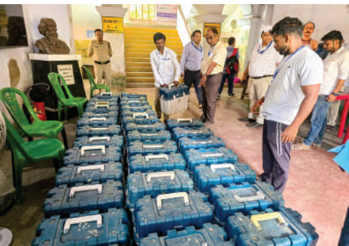
दक्षिण भारत की राजनीति के सबसे महत्वपूर्ण राज्य तमिलनाडु में इस वक़्त धीरे-धीरे के स्टालिन की सरकार है। एफ़िजट पोलस की माने, तो स्टालिन इस चुनाव में भी अंतिम प्रदर्शन करने वाले हैं। धीरे-धीरे अंत्य अंतिम एक बार फिर से राज्य में सरकार बनाने वाले हैं। हालांकि, अभिमत से भेजा पूने विजय का प्रयाम भी पोलस ने नगारा नहीं है। इसके अलावा भाजपा और एआईएमके के साथ उसका गठबन्धन एक बार फिर से विपक्ष में बंटता हुआ नजर आ रहा है।