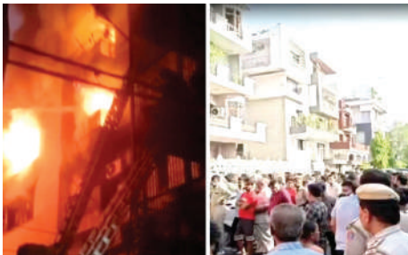
प्रधानमंत्री राहत कोष से 2 लाख रुपए दिए जाएंगे। वहीं, घायलों को 50 हजार रुपए की मदद मिलेगी।