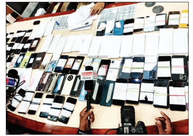
करोड़ों की ठगी पर लगाम

साइबर जागरूकता अभियान के तहत मार्च-अप्रैल में 5 स्कूल-कॉलेजों में 3500 से अधिक लोगों को जागरूक किया गया। जयपुर पुलिस की इस कार्रवाई