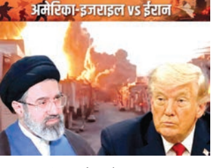
अमेरिका-इजराइल vs ईरान

संयुक्त अरब अमीरात (यूई) ने दावा किया है कि ईरान ने उसके खिलाफ 2 बैलिस्टिक मिसाइल और 3 ड्रोन दागे हैं। यूई रक्षा मंत्रालय ने ट्वीटर पर पोस्ट कर कहा कि सभी टारगेट्स को हवा में ही मार गिराया गया। हमले में 3 लोग घायल हुए हैं। हालांकि इस दावे पर ईरान की तरफ से कोई आधिकारिक प्रतिक्रिया नहीं आई है। इसी बीच अमेरिका ने सीजफायर के बावजूद ईरान पर फिर बमबारी की। अमेरिका ने कहा कि ईरानी सेना ने उसके जंगी जहाजों पर मिसाइल, ड्रोन और छोटी नावों से हमला किया था।