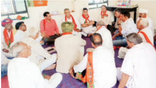
मजबूती और सरकारी योजनाओं को जन-जन तक पहुंचाने, मन की