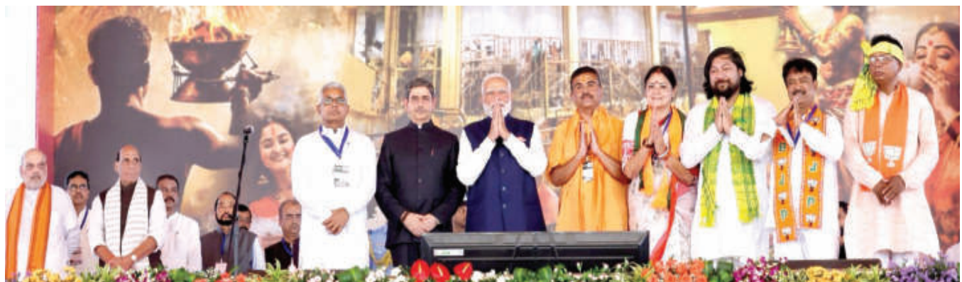
शुभेंदु का स्थानीय पार्षद से मुख्यमंत्री बनने तक का सफर

नई दिल्ली। पश्चिम बंगाल में भारतीय जनता पार्टी का सोनार बांग्ला युग शुरू हो गया है। सुवेंदु अधिकारी शनिवार को राज्य के मुख्यमंत्री के तौर पर शपथ ले ली है। बीजेपी को विधानसभा चुनावों में जबरदस्त जनदेश मिला और उसने 293 में से 207 सीटें जीतीं। भले ही पश्चिम बंगाल को बीजेपी के लिए राजनीतिक रूप से एक मुश्किल क्षेत्र माना जाता रहा हो, यहाँ तक कि पूरे भारत में पार्टी के विस्तार के दौरान भी लेकिन यह नया युग भावा पार्टी की लंबी वैचारिक और सांगठनिक लड़ाई का प्रतीक है। बंगाल को अपना पहला बीजेपी का मुख्यमंत्री