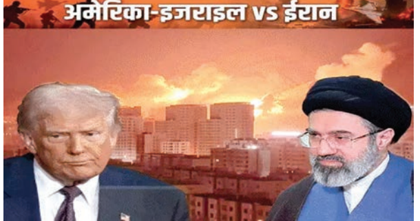
तेल अवीव/तेहरान/वाशिंगटन डीसी।

अमेरिका अगले हफ्ते ईरान पर दोबारा सैन्य हमले की तैयारी कर रहा है। न्यूयॉर्क टाइम्स के रिपोर्ट्स के मुताबिक, पेंटागन ने हमले के कई विकल्प तैयार किए हैं और अब अंतिम फैसला राष्ट्रपति डोनाल्ड ट्रम्प को लेना है। अमेरिकी रक्षा मंत्री पीट हेगसेथ ने कहा कि जरूरत पड़ने पर सैन्य कार्रवाई बढ़ाने की योजना तैयार है। अमेरिकी अधिकारियों के मुताबिक, हमले के विकल्पों में ईरान के सैन्य और इन्फ्रास्ट्रक्चर टिकानों पर बड़े हवाई हमले शामिल हैं। एक विकल्प अमेरिकी स्पेशल ऑपरेशन फोर्सज को जमीन पर उतारकर इस्फाहन परमाणु साइट में दबे परमाणु सामग्री यानी एनरिचड यूरेनियम तक पहुंचने का भी है। हालांकि अधिकारियों ने माना कि ऐसा ऑपरेशन बेहद जोखिम भरा होगा और इसमें भारी सैन्य नुकसान हो सकता है। रिपोर्ट के मुताबिक, अमेरिका ने मिडिल-ईस्ट में 50 हजार से ज्यादा सैनिक तैनात रखे हैं। इसके अलावा दो एयरक्राफ्ट कैरियर, एक दर्जन से ज्यादा नेवी डेस्ट्रॉयर्स और बड़ी संख्या में लड़ाकू विमान भी क्षेत्र में मौजूद हैं। करीब 5 हजार मरीन और 82वीं एयरबोर्न डिवीजन के 2 हजार पैराट्रूपर्स भी आदेश का इंतजार कर रहे हैं।