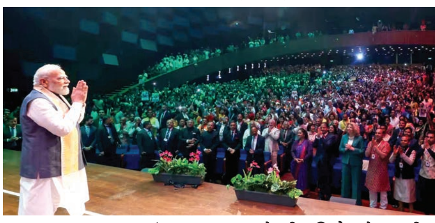
नीदरलैंड में भारतीय मूल का सूरिनामी समुदाय वर्धा में

द हेग। प्रधानमंत्री नरेंद्र मोदी के नीदरलैंड दौर पर हैं। उन्होंने द हेग में भारतीय समुदाय को संबोधित करते हुए दुनिया के मौजूदा हालात पर चिंता जताई। मोदी ने कहा कि आज मानवता के सामने कई बड़ी चुनौतियां हैं। ये दशक आपदाओं का दशक बन गया है। दुनिया पहले कोरोना, फिर युद्ध और अब ऊर्जा संकट से जूझ रही है। अगर हालात नहीं बदले तो बीते कई दशकों के काम पर पानी फिर जाएगा और दुनिया की बहुत बड़ी आबादी गरीबी के दलदल में फंस जाएगी। नीदरलैंड का राज परिवार यूरोप के सबसे पुराने शाही परिवारों में से एक माना जाता है। इसे हाउस ऑफ ऑरेंज-नासाउ कहा जाता है।