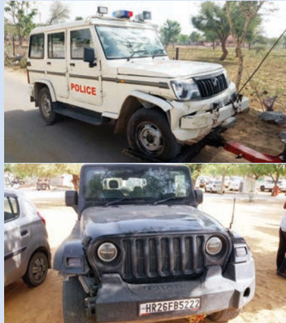
स्थिति जानी और गौतडा थाने में पूरे घटनाक्रम की समीक्षा की।