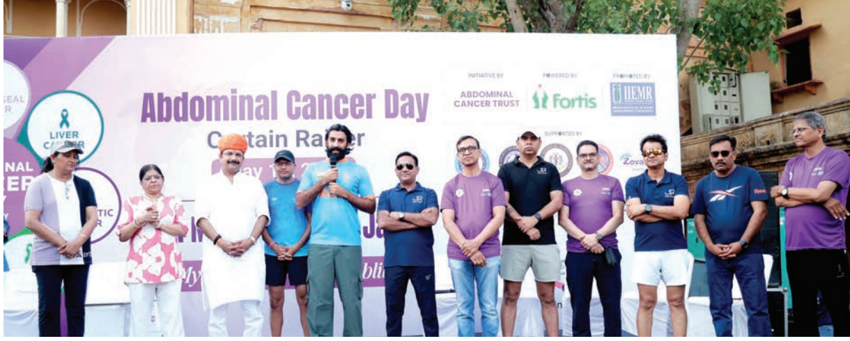
राष्ट्रीय स्तर की पैलन चर्चा आयोजित होगी, जिसमें देशभर के विशेषज्ञ कैंसर की शुरुआती पहचान, एआईआधारित तकनीक और आधुनिक जांच पद्धतियों पर चर्चा करेंगे। विशेषज्ञों के अनुसार एब्डोमिनल कैंसर में पेट के भीतर होने वाले गैस्ट्रिक, लिवर, पैंक्रियाटिक, कोलन, गॉल ब्लैडर और ओवेरियन कैंसर शामिल हैं। समय पर जांच और जागरूकता से इनका प्रभावी उपचार संभव है।