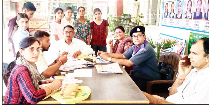
शिविर में चुड़सवारी, सिलाई, पेंटिंग, क्राफ्ट जैसे विषयों का प्रशिक्षण दिया जा मेंहंदी, वाद्य यंत्र, कंप्यूटर, आर्ट एंड