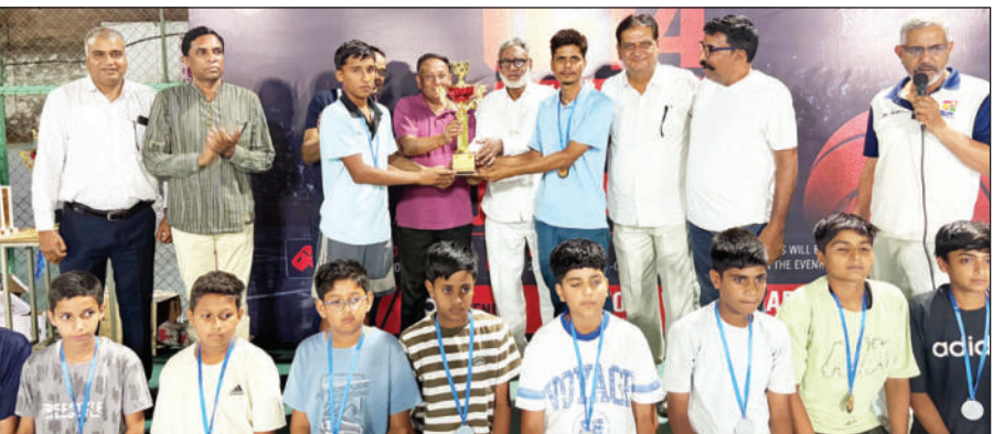
एसएस मोदी विद्या विहार झुंझुनू को 24-16 से हराकर फाइनल में